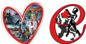
Logo Konferencji i Eur. Stowarzyszenia